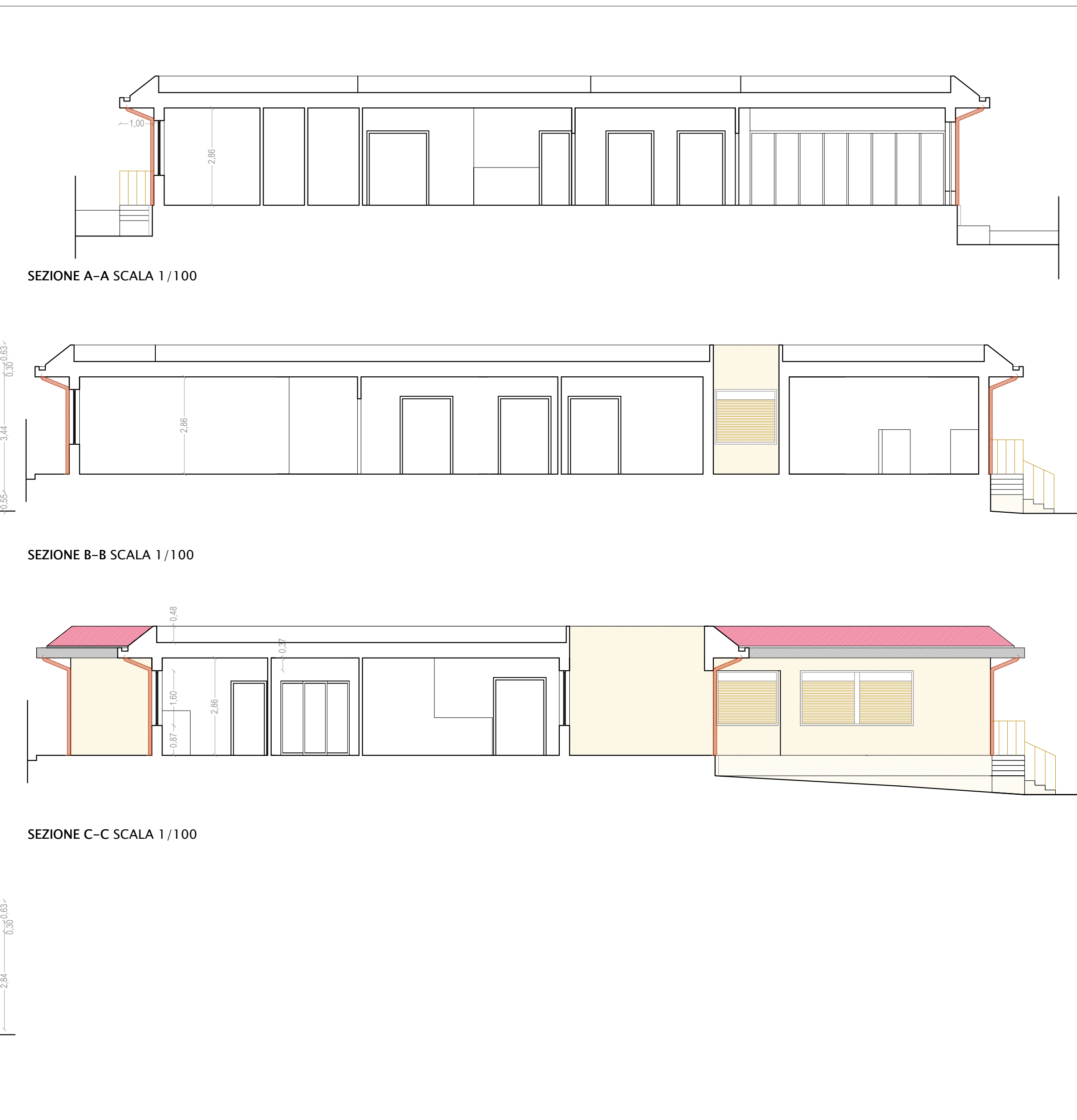
SEZIONE C-C SCALA 1/100