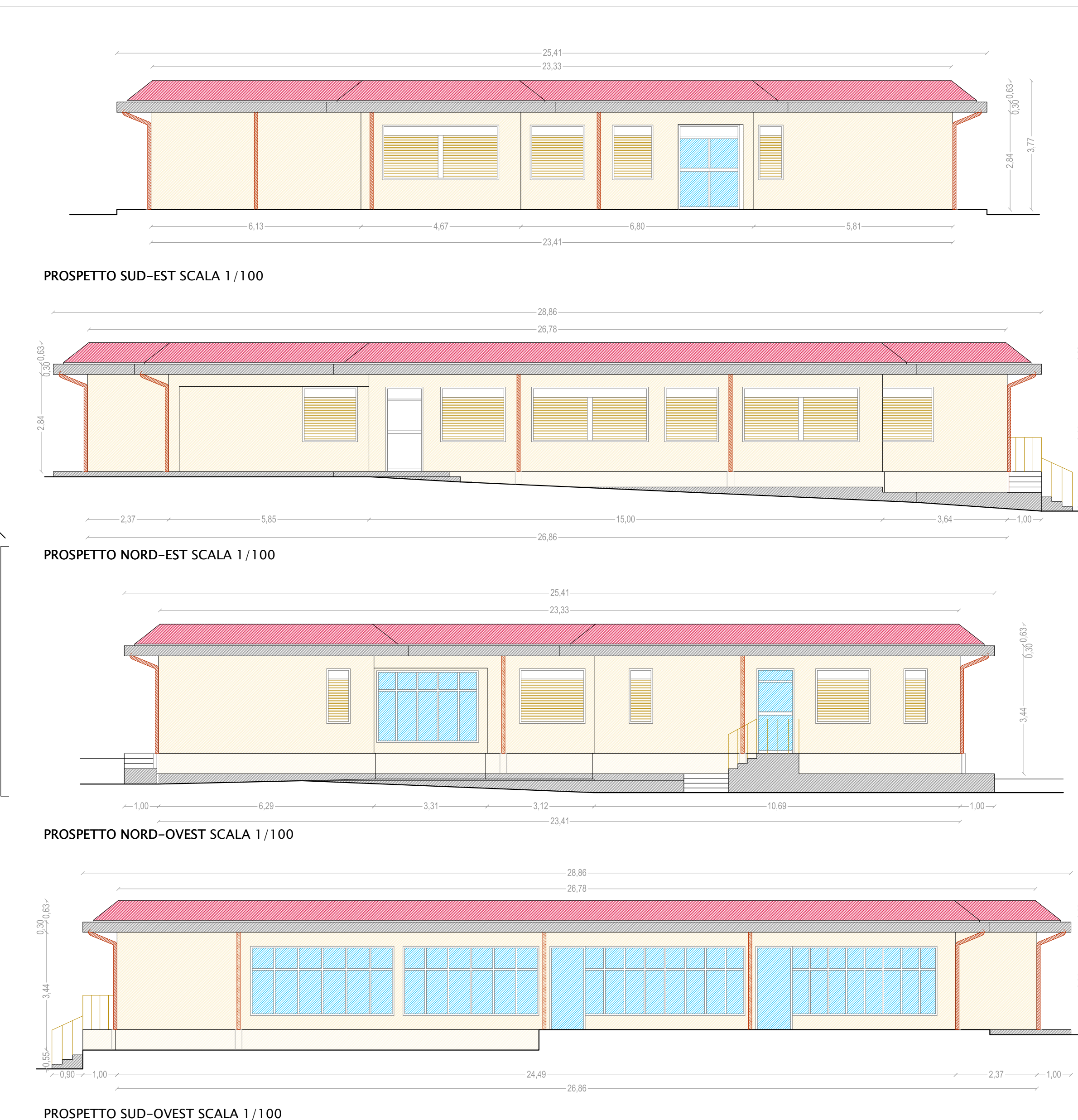
PROSPETTO SUD-OVEST SCALA 1/100