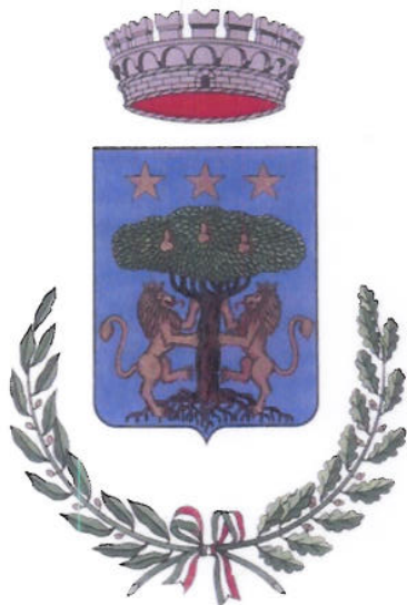
Comune di Capaci