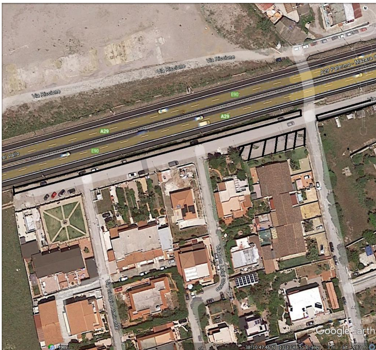
n.12: ZONA MARE – VIA RAPALLO (prossimità autostrada A29 e via Riccione).