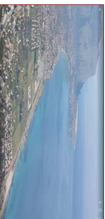
foto panoramica in direzione Capaci