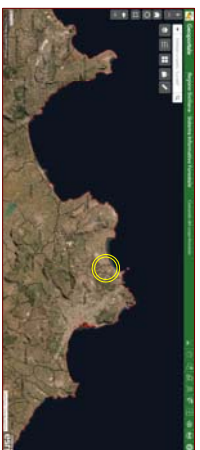
Inquinamento territoriale portuale SP